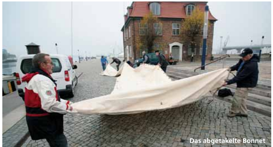
Das abgetakelte Bonnet

– wieder flott und fit für die neue Segelsaison zu machen. Na da wird einem wieder wohler ums Herz und man sieht die „Wissemara“ in Gedanken wieder mit vollem Segel über das Wasser fliegen – schööön. Daran haben bestimmt auch die über 60 Hände am 29. Oktober dieses Jahres beim Abtakeln gedacht. Und eine Regel steht wie jedes Jahr, wenn der Kapitän sagt, wir treffen uns zum Abtakeln um 9.00 Uhr, geht es bestimmt schon spätestens um 8.30 Uhr los, weil fast alle schon da sind und einfach nicht rumstehen können. Nachzügler, die pünktlich um 9.00 Uhr kommen, sehen dann das „Segel schon von Bord