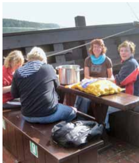
Der „Chickenclub“ bei der Arbeit