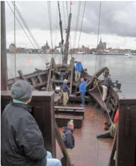
Stralsund ist in Sicht