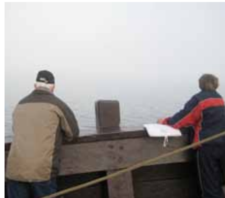
Hier sollte die Kreideküste zu sehen sein...

Hier würden Sie jetzt die Kreidefelsen, Königsstuhl und Stubbenkammer sehen können. Dieses Foto passt dafür immer. Auch auf dem Deck war die Sicht schon eingeschränkt.