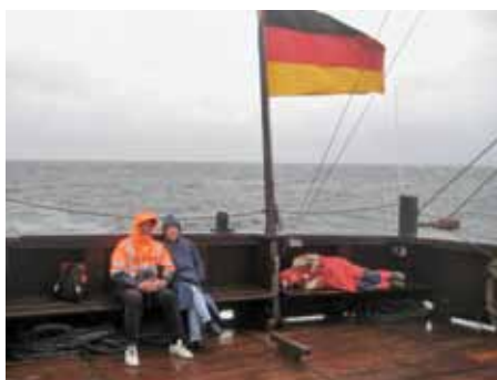
Regen, Regen, Regen...

Jedenfalls waren die meisten Mitsegler, Tagesgäste und Mitglieder der Crew an Deck, um die ersten Segelaktionen hautnah zu erleben bzw. dabei aktiv zu werden. Apropos hautnah: wer keine wetterfeste Kleidung dabei hatte, musste binnen kürzester Zeit das freie Deck oder Kastell verlassen und sich das Spektakel inkl. Dauerregen und güns-