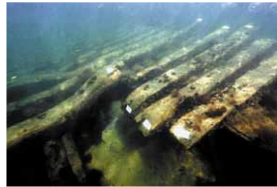
1997 gab es eine Sensation: vor der Insel Poel wurde das bislang größte Schiffswrack der Hansezeit entdeckt – doch die damalige Datierung könnte fehlerhaft sein.

Wie war nun das Jahr 2011? Eigentlich vom Sommer her einfach nur schrecklich nass, trüb und gefühlt deutlich zu kühl und eines Ostseesommers nicht richtig würdig. Das kennen wir eigentlich anders. Was hat das für unsere Kogge bedeutet? Das war irgendwie nicht zu spüren. Insgesamt 154 Segeltage sind gegenüber 140 im Vorjahr tatsächlich ein neuer Bestwert. Und wer den Bericht eines Mitseglers auf der Seite 3 dieser Ausgabe liest, erkennt, es geht auch bei so einem Wetter eine ganze Menge. Insgesamt legte unsere Kogge 3.582 See-