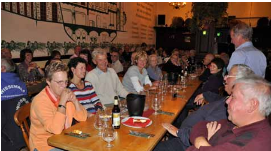
In der Brauerei: Verprobung der „Störtebeker“-Bierspezialitäten

auch den Partnerschaftsvertrag zwischen der Stralsunder Brauerei GmbH und unserem Förderverein.