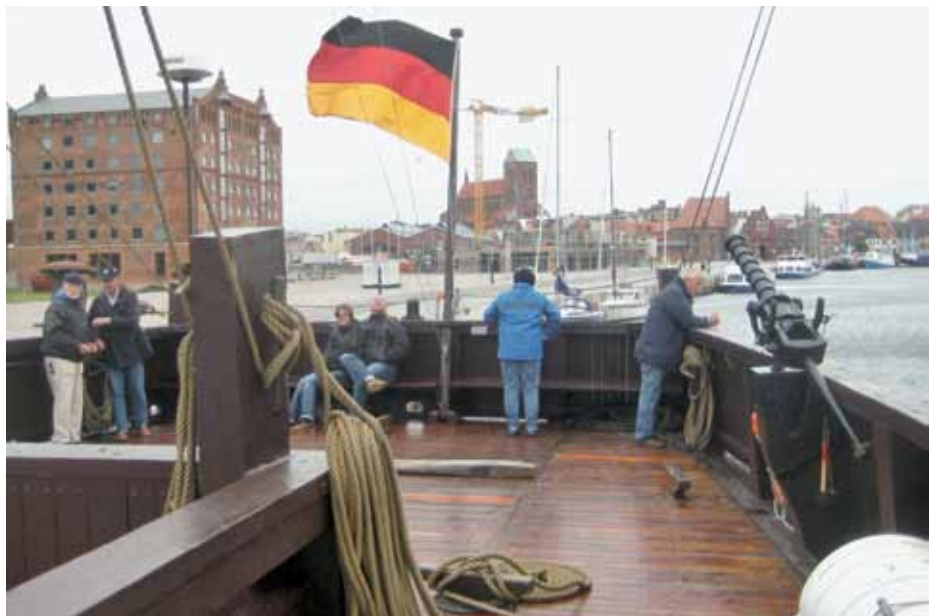
24. Juli 2011: Die „Wisse Mara“ läuft aus dem Wismar Hafen

tigem Westwind vom geschützten Bereich unter dem Kastell oder der zügigen Plane anschauen, sonst wäre man durchnässt bis auf die Haut.