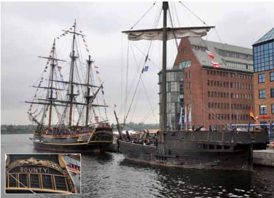
Der Nachbau der legendären „Bounty“ lag direkt neben unserer „Wissemara“.

Die nächste Hanse Sail steht vor der Tür, und zwar in der Zeit vom 9. bis 12. August 2012. Für die Hinfahrt mit der „Wissemara“ gibt es für Mitsiegler noch freie Plätze.