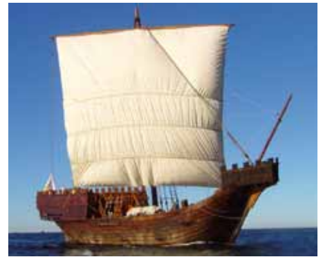
Die „Twekamp af Elbogen“ (oben) und die „Roland von Bremen“

Die beiden vorgenannten Entwicklungen belasten selbstverständlich auch die KoggenCompagnie. Bei allen vorgenannten und leider negativen Tendenzen ist auch noch etwas Positives zu melden. Bei unseren Freunden in Torgelow wurde der Startschuss, d. h. die Mittel zum Weiterbau der Uecker-Randow-Kogge, freigegeben. Der Bau soll in zwei Jahren beendet sein, womit die KoggenCompagnie wieder einen Zuwachs zu verzeichnen kann. Herzliche Glückwünsche nach Torgelow und viel Erfolg bei der Fertigstellung der Kogge.