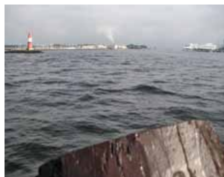
Warnemünde mit Kreuzfahrer in Sicht

Aber auch das konnte uns nicht erschüttern – obwohl es für alle sehr schade war!! Zumal dann am Nachmittag in Warnemünde schön die Sonne schien... Das im Hintergrund sichtbare Traumkreuzfahrtschiff und das in der Nacht angekommene 3-Master-Traumsegelschiff sind kein Vergleich zu „unserem“ liebgewonnenen Rahsegler „WISSEMARA“ nebst gesamter Crew und den 14 Zehntagesgästen mit der herrlichen einfachen und unkomplizierten Lebens- und Umgangsweise an Bord!!!