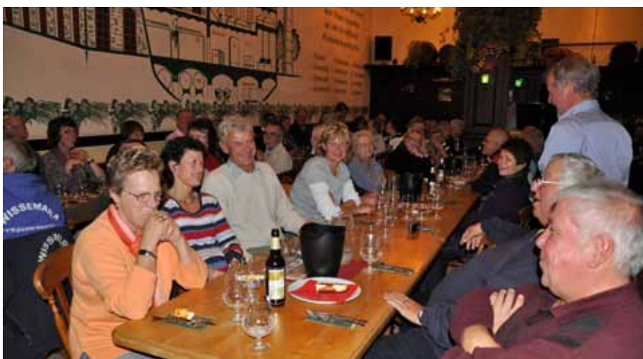
In der Brauerei: Verprobung der „Störtebeker“-Bierspezialitäten

auch den Partnerschaftsvertrag zwischen der Stralsunder Brauerei GmbH und unserem Förderverein.