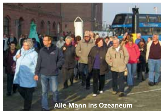
Alle Mann ins Ozeaneum

Die nächste Station unserer Tour war die Stralsunder Brauerei mit dem uns bekannten Störtebeker Bier. Koggen und Brauereien waren schon immer eng verbunden, denn Bier war der Exportartikel der Hansezeit und die Koggen die Bierlastesel. Seit diesem Jahr gibt es nun