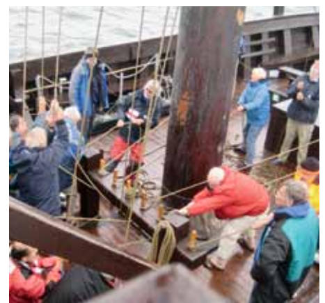
Einholen des Segels – alle Hände werden gebraucht.

griff: „Brassen“ auf. Alle, die wollten, konnten und durften („Landratten“), machten bei diesen Manövern neben den Hauptakteuren der Crew mit.