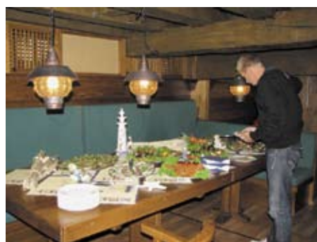
Beispiel für ein Büfett auf der Kogge

Noch intensiver kann man das Schiff jedoch während eines Törns erleben. Regelmäßig im Angebot, und besonders bei Urlaubsgästen und Familien sehr beliebt, sind die so genannten offenen Fahrten. Die Passagiere erleben einen Segeltörn